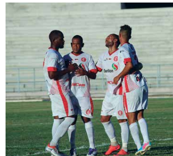
O Internacional ainda luta para escapar da zona de rebaixamento

Nas duas últimas rodadas, o Sousa terá pela frente o Serrano, em Campina Grande, e o CSP, no Marizão. O Inter jogará contra o Atlético, em Cajazeiras, e o Auto no Almeidão.