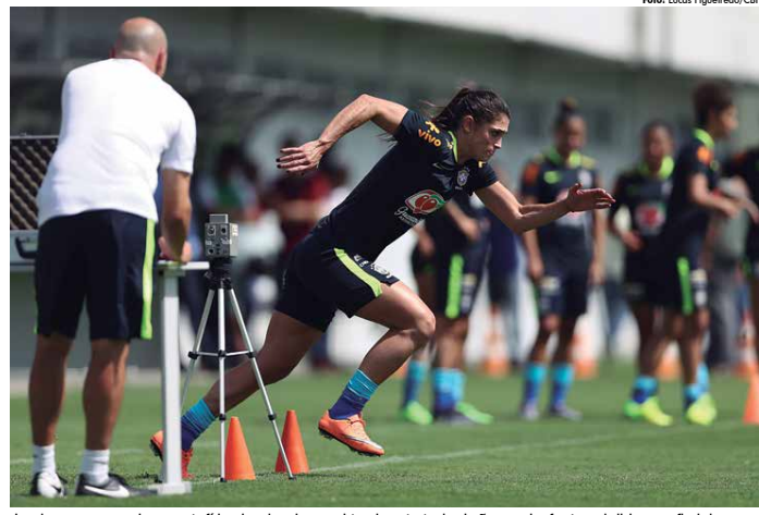
Jogadoras seguem o aprimoramento físico visando mais um amistoso importante da seleção que vai enfrentar a Bolívia no final de semana